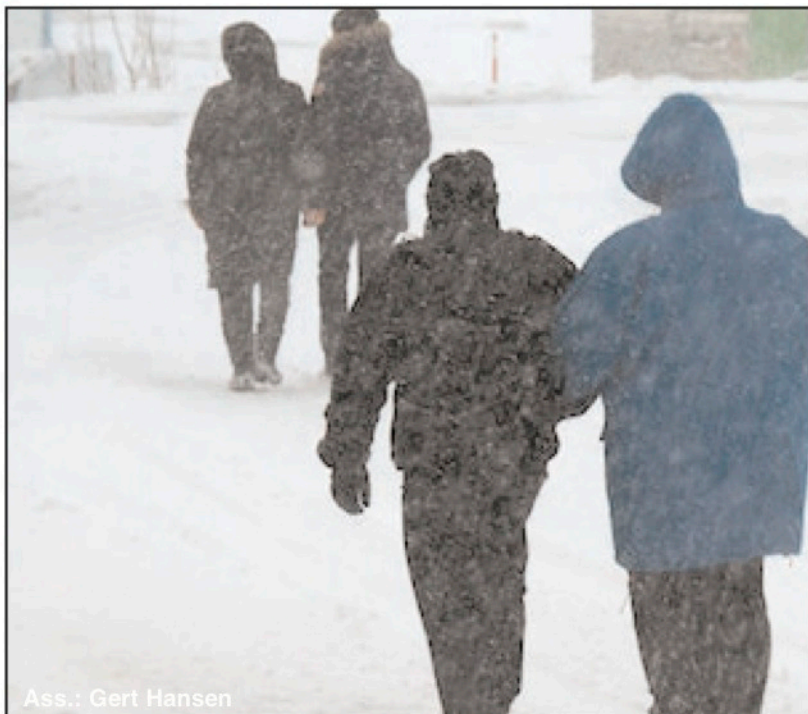
Ass.: Gert Hansen

27. januar 2022 www.kujataamiu.gl • mail: kujataamiu@gmail.com