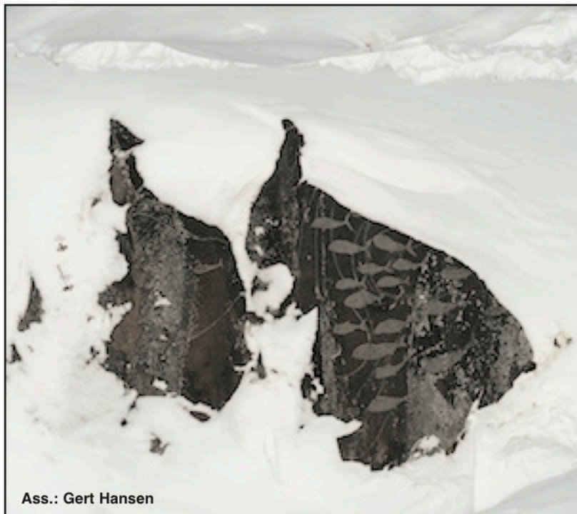
Ass.: Gert Hansen

www.kujataamiu.gl • mail: kujataamiu@gmail.com