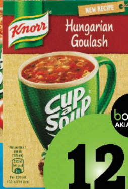
KNORR SOUP IMLT. / EL. BOUILLON, 20 - 63 g Assigining, arlalit / flere varianter