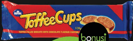
TOFFEE CUPS, 120 g