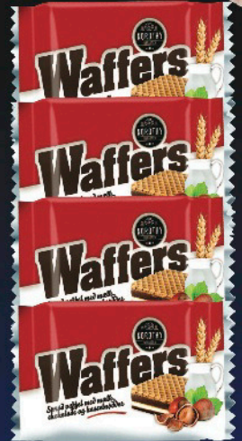
WAFFERS, 4 x 25 g