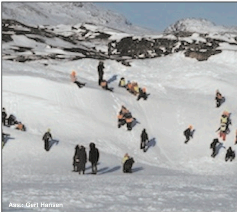
Ass.: Gert Hansen

5. marts 2020 www.kujataamiu.gl • mail: kujataamiu@gmail.com