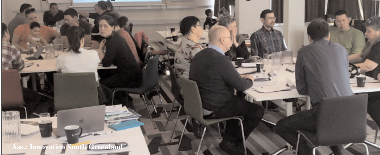
Ass.: Innovation South Greenland

Kujataani Takornariaqartitsisut alloriarneq siulleq tiguaat Kujataani najukkami takornariaqarnikkut inerisaanermi iliuusissanik nutaanik pilersaarusiortoqaler-mat. Februarip ulluisa 18-anni aamma 19-anni Kujataani takornarialerisut 29-it naapisimaarput, aggettullu savaateqarfinnerisut qulingiluaneerput, aamma makkunaniit peqataasoqarpoq: Aappilatooq, Igaliku, Nanortalik, Narsarsuaq, Qaqortoq, Qassiar-suk.