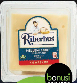
RIBERHUS Kitsigaq / i skiver, 340 g