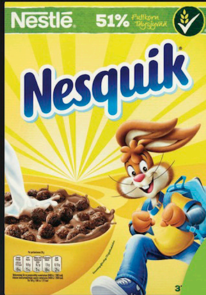
NESTLÉ ULLAAKKORSIUTIT / Morgenmad, 350 - 500 g Assigiinng. arlallit / flere varianter

bonusi AKIA / PRIS 9.- Sipaakkit Spar op til 4 95