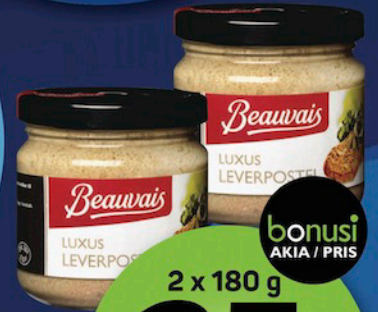
BEAUVAIS LUXUS TINGULIAQ / Leverpostej

bonusi AKIA / PRIS 12.- Sipaakkit Spar op til 4 95