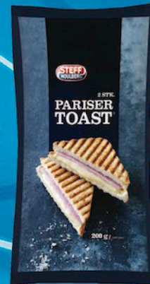
STEFF HOULBERG PARISER- IMLT. / EL. COWBOYTOAST, 200 - 290 g

bonusi AKIA / PRIS 12.- Sipaakkit Spar 7 95