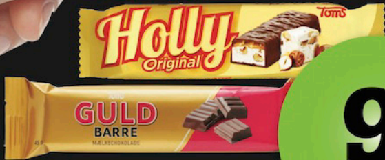
TOMS GULD BARRE, 40 - 50 g Assigiinng. arlallit / flere varianter

bonusi AKIA / PRIS 9.- Sipaakkit Spar op til 4 95