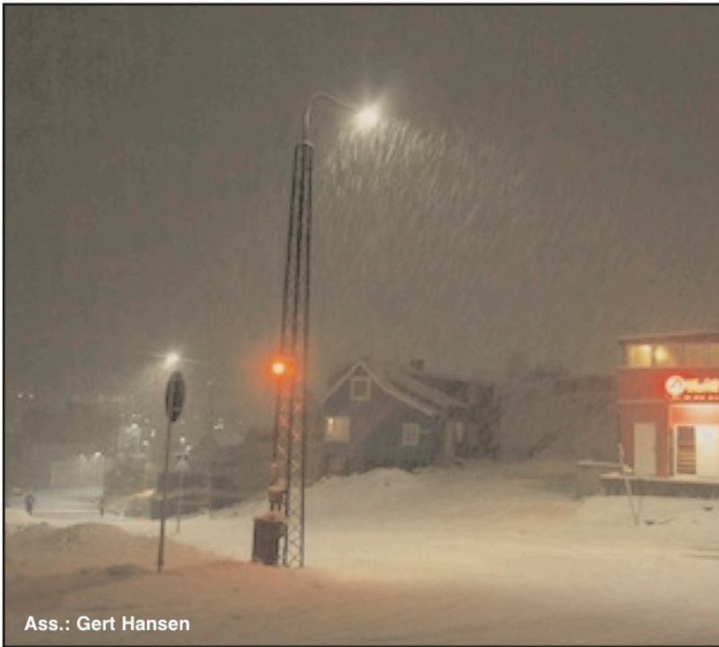
Ass.: Gert Hansen

www.kujataamiu.gl • mail: kujataamiu@gmail.com