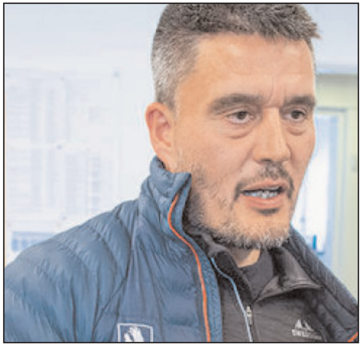
Naalakkersuisut siulittaasuat Kim Kielsen (S)

“Ilisimaneqartutullu suliariumannittussarsiuussineq qanittu-mi aallartinneqartussaavoq, tassungalugu ataatillugu periarfissaqarpugut ersarissunik piumasaqaateqartarnissatsinnut aammalu aallarsinnaanerit tikissinnaanerillu qaffasissumik pitsaassuseqartinneqassasut piumasaqaatitsinni ilaatitarpagut.