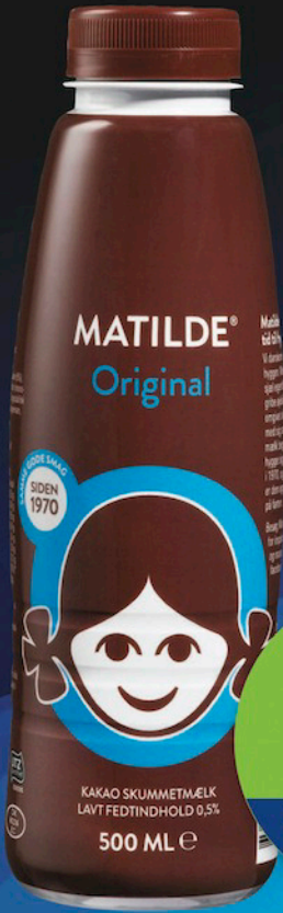
MATILDE CACAO DRIK, ½ liter Assigiinng. arlallit / flere varianter

QAAMMAMMI BONUSI PITSAK Uku neqeroorutit februar tamaat atuutissapput