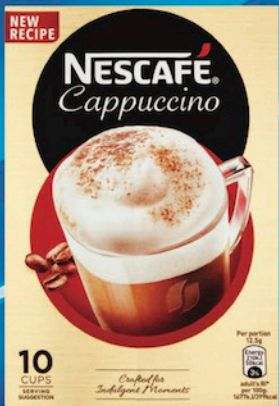
NESTLÉ CHOCO IMLT. / EL. COFFEE, 125 - 200 g Assigiinng. arlallit / flere varianter

bonusi AKIA / PRIS 2 x 180 g 25.- Sipaakkit Spar 18 90