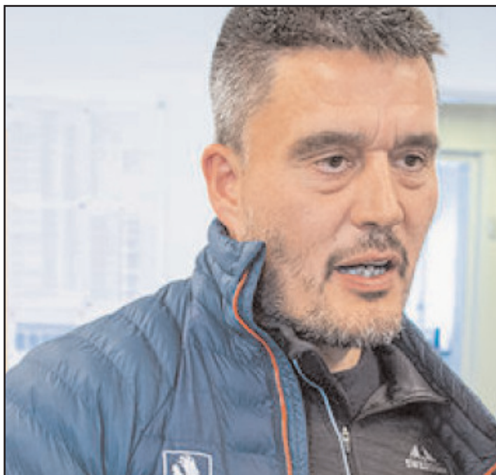
Formanden for Naalakkersuisut Kim Kielsen (S)

“Men som bekendt er udbudsrunder lige om hjørnet, og det er der, hvor vi har mulighed for at opstille klare og ufravi-